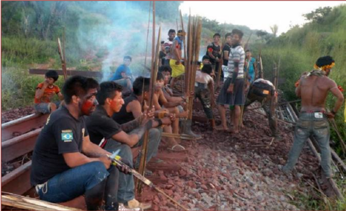
Ocupação de um trecho da Estrada de Ferro Carajás por comunidade indígenas do Maranhão.

A questão fundiária é o centro da questão dos movimentos de resistência aos grandes projetos econômicos implementados na Amazônia, dentre eles o Programa Grande Carajás. Mesmo antes da ditadura civil-militar, regiões do Pará, Maranhão e Tocantins sempre foram alvo de disputa de comunidades locais, grupos indígenas, pequenos agricultores, latifundiários e grandes empresas mineradoras.