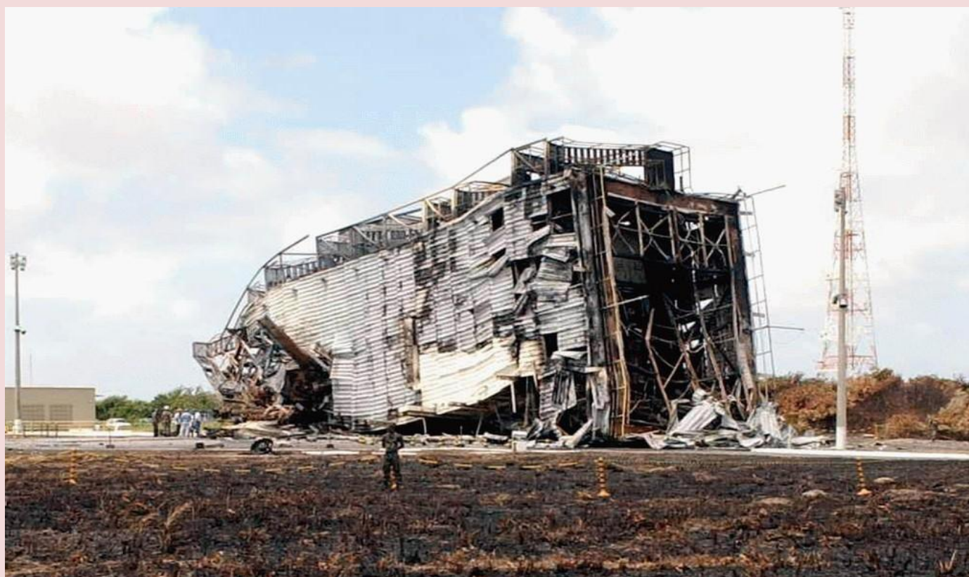
Base de Alcântara após o acidente em agosto de 2003.

Vale ressaltar que o Centro de Lançamento de Alcântara foi palco de tragédias em sua história, incluindo acidentes durante testes de foguetes que resultaram em perdas de vidas e danos materiais. O maior desastre da história do Programa Espacial Brasileiro aconteceu em 22 de agosto de 2003 2 , dias antes do lançamento do protótipo VLS-1 que colocaria em órbita dois satélites nacionais. Esse evento levou a uma revisão e reestruturação das operações no centro e a um foco renovado na segurança e na cooperação internacional no campo das atividades espaciais.