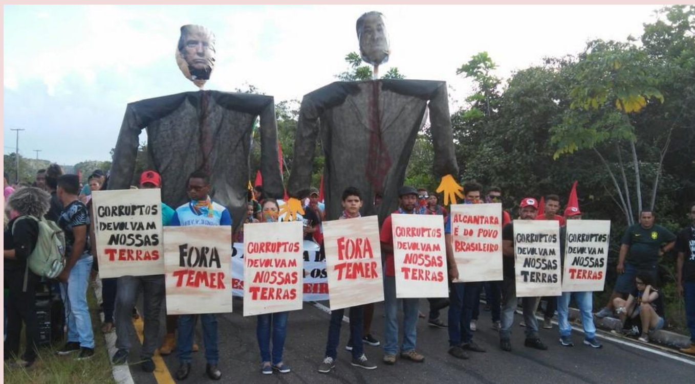
Imagens de protesto de que reuniu centenas de manifestantes em Alcântara (2012) – Foto G1 Maranhão.

Diante dessa realidade, as comunidades quilombolas de Alcântara desenvolveram diversas formas de resistência ao longo de décadas. Inicialmente, manifestou-se de forma mais individual e cotidiana, através da recusa em abandonar o território, da manutenção de práticas culturais tradicionais e da adaptação criativa às novas circunstâncias. Com o tempo, e especialmente após a redemocratização do país, a resistência ganhou contornos mais organizados e políticos, com a formação de associações comunitárias, articulação com movimentos sociais e organizações de direitos humanos, e o acionamento de instâncias judiciais nacionais e internacionais.