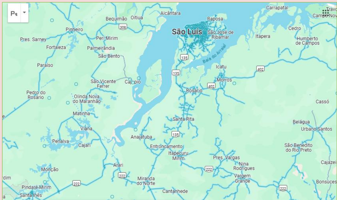
Mapa da região que compreende os municípios de Santa Rita, Anajatuba, Bacabeira e Itapecuru-Mirim.

Nessa região, centenas de famílias vivem da pesca e agricultura complementando suas rendas através de programas sociais do Governo Federal como aposentarias e Bolsa Família. Como forma de combater essa situação de precariedade, em 2010 foi fundada a Associação de Moradores do Outeiro dos Pires (ASMOP) que, em 2012, anexou abaixo assinado ao inquérito civil público nº 1.19.000.001554/2010-87 aberto pelo povoado Retiro São João da Mata junto ao Ministério Público Federal.