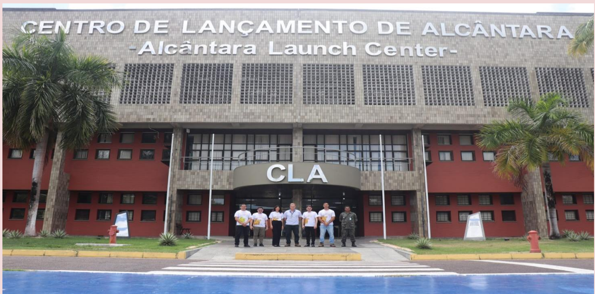
Imagem de visitação da comitiva da Secretaria do Estado de Turismo (Setur – MA) ao Centro de Lançamento de Alcântara no ano de 2023.