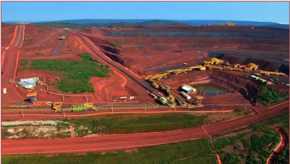
Imagem: Mina S11D – Serra Sul de Carajás, município de Canaã dos Carajás - Pará / Fotos Públicas (Fonte: https://www.brasildefato.com.br/2018/05/19/projeto-grande-carajas-desestrutura-comunidades-e-territorios-indigenas/ ).

O Programa Grande Carajás tem sido objeto de debate ao longo dos anos, envolvendo críticas relacionadas aos impactos ambientais da exploração de recursos naturais e dos impactos sobre as comunidades locais. No entanto, também é visto como