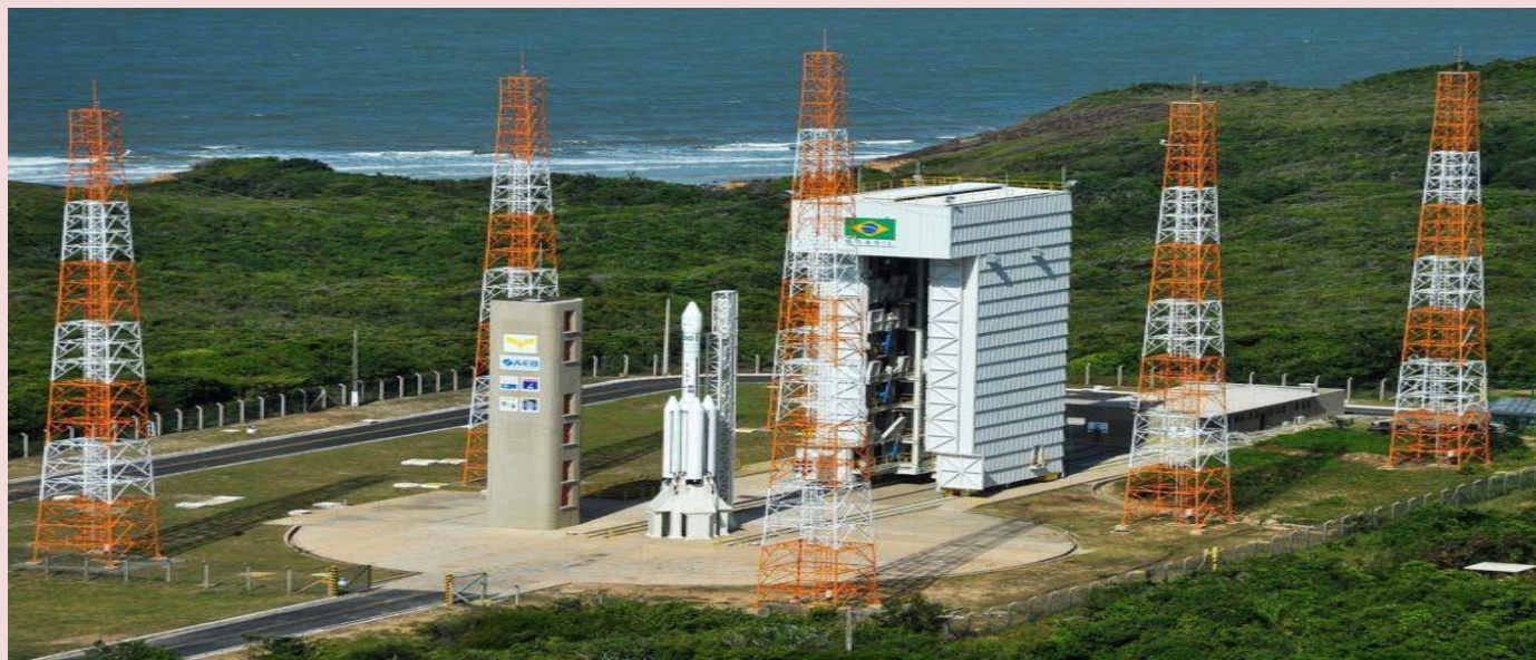
Imagem da Base de Alcântara.

Inserido nessa realidade de implementação do programa espacial brasileiro que o presidente à época João Figueiredo instituiu o decreto nº 88.136, de 1º de março de 1983 criando o Centro de Lançamento de Alcântara (CLA) com a finalidade de executar e apoiar as atividades de lançamento e rastreamento de engenhos aeroespaciais, bem como executar testes e experimentos de interesse do Ministério da Aeronáutica, relacionados com a Política Nacional de Desenvolvimento Aeroespacial.