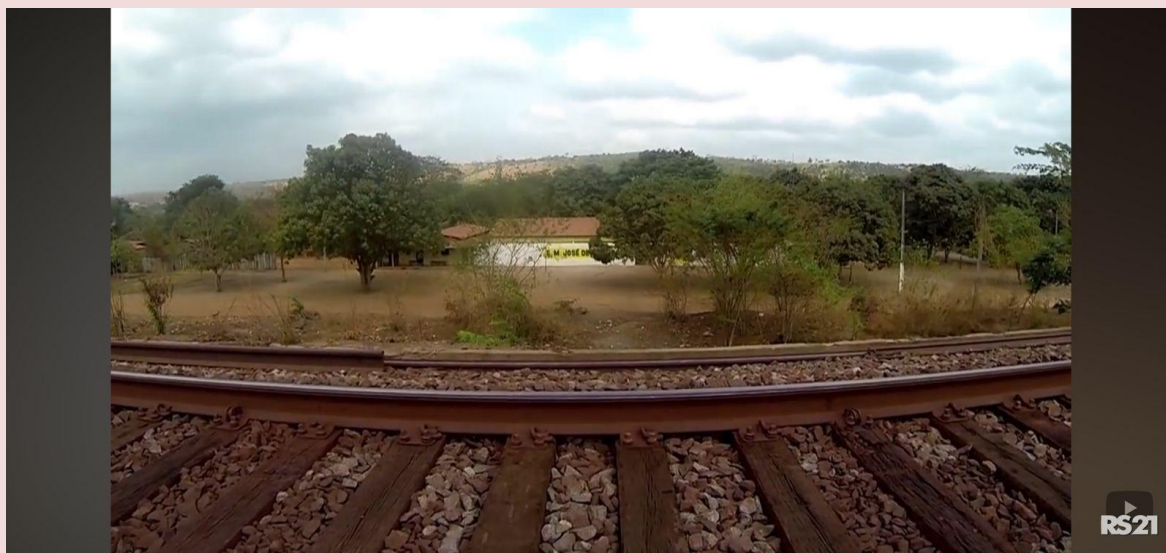
Imagem: Escola Municipal de Buriticupu próxima a EFC.

destaca pelas casas e outras edificações que ficaram comprometidas a partir da implementação da estrada de ferro.