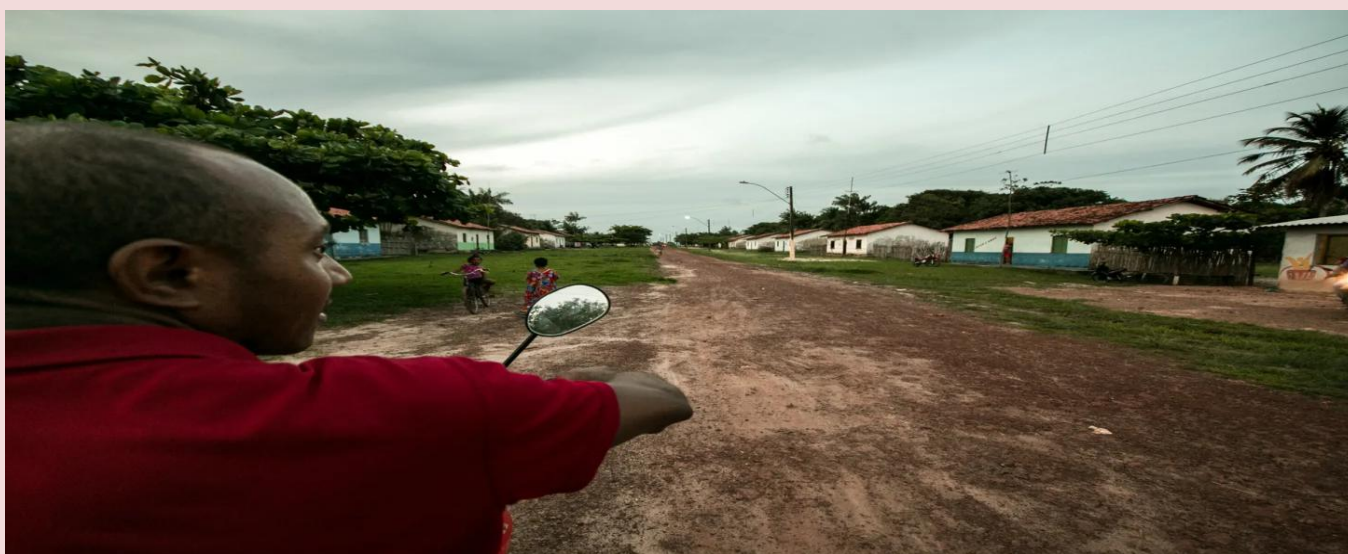
Rua principal da agrovila Marudá, construída para abrigar quilombolas removidos da área onde se instalou o Centro de Lançamento de Alcântara.

As agrovilas, concebidas segundo um modelo urbanístico padronizado e alheio às realidades culturais das comunidades, impuseram uma reorganização radical do espaço e das relações sociais. As casas, dispostas em traçado retilíneo e com tamanho padronizado, contrastavam com o padrão tradicional de ocupação dispersa e adaptada às condições ambientais locais. Além disso, as agrovilas foram construídas distantes do mar, dificultando a prática da pesca, atividade fundamental para a subsistência e identidade cultural dessas comunidades.