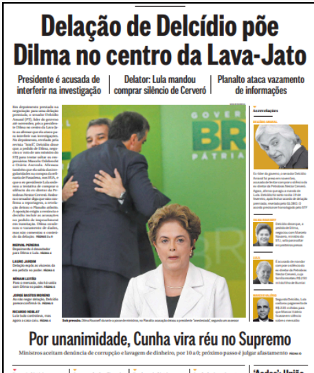
O Globo, 04/03/2016.