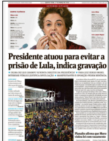
Folha de São Paulo, 17/03/2016.

Essas duas capas podem ser utilizadas nessa aula, mas as possibilidades são diversas professor (a).